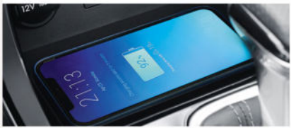
Chargeur de smartphone sans fil