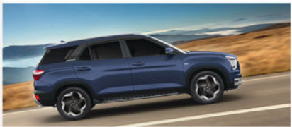
ABS + contrôle électrique de stabilité (ESC) + assistance au départ en mon tée (HAC)