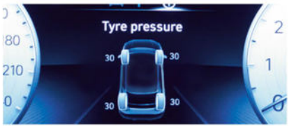
Système de surveillance de pression des pneus (Option)